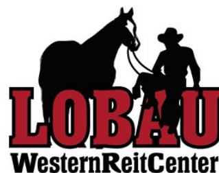
WESTERN RIDING PATTERN III