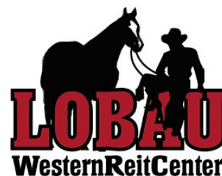
Western Riding Pattern 12